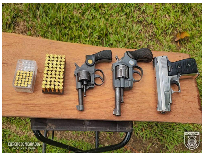
Fotografía del Ejército de Nicaragua con decomiso de armas de fuego ilegales.