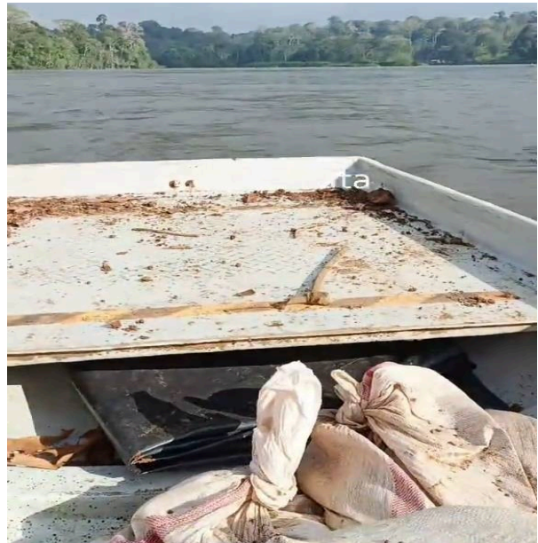
Traslado de material minero/ broza sobre el río San Juan.