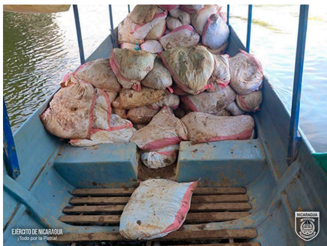
Fotografía del Ejército de Nicaragua con brozas en bote sobre el río San Juan.

Así como, el nombre de personas retenidas, entre otros. Detalles importantes para determinar las dinámicas de minería ilegal en la zona. Adicionalmente, dichos reportes permiten confirmar el tráfico ilegal de armas y municiones asociado a la actividad de minería ilegal en la zona.