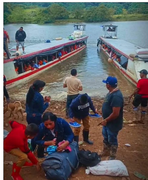
Embarcaciones de transporte público transportando mineros ilegales y descargando insumos en Las Cruces.