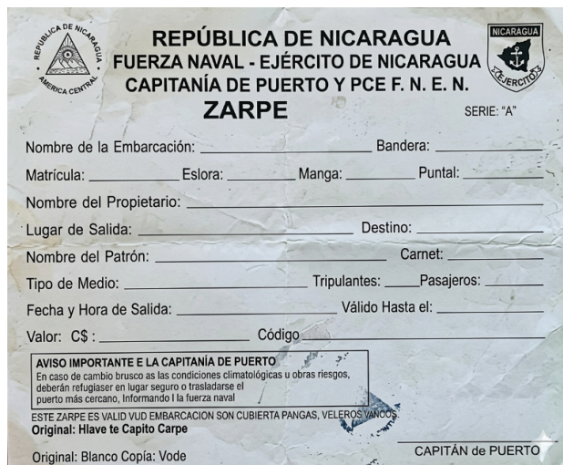
Fotografía del zarpe emitido por la Fuerza Naval del Ejército de Nicaragua.

Mientras, los transportistas de embarcaciones de transporte público y privado siguen desembarcando en sitios no autorizados tanto en Costa Rica como en Nicaragua, permitiendo el flujo de mineros ilegales y proveyéndoles de mercancías e insumos que son utilizados en la actividad de minería ilegal, sin que exista ninguna sanción al respecto. La organización también ha observado la construcción de un muelle presuntamente ilegal en la entrada del sector de Las Cruces, conocido como muelle Los Tiburones.