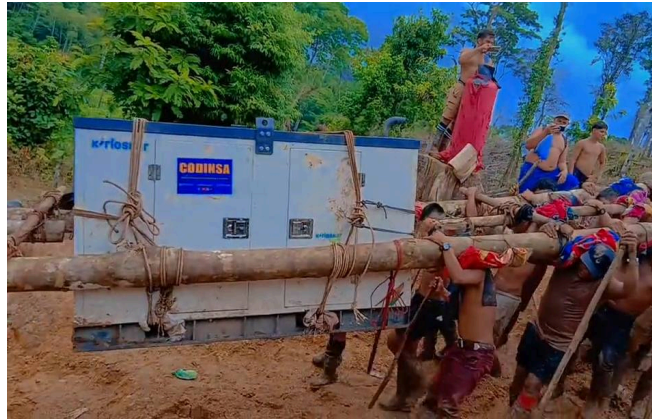
Mineros ilegales introducen generador eléctrico en el sector de Las Cruces (11 de mayo 2026).

Además se ha identificado un nuevo sitio de minería ilegal, en los cerros La Conchuda (círculo amarillo) y El Conchudo (círculo azul) del lado de Nicaragua, ubicados en el Refugio de Vida Silvestre río San Juan. Dichos sitios se encuentran a unos 3.2 kilómetros del puesto del Ejército de Nicaragua y del Ministerio de Ambiente y los Recursos Naturales (Marena), ubicado en la desembocadura del río San Carlos y a tan solo un kilómetro del cerro Conchudita (círculo rojo) de Costa Rica.